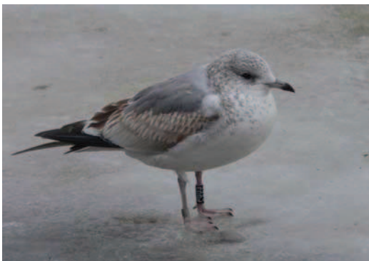
Paprastasis kiras ( Larus canus ).