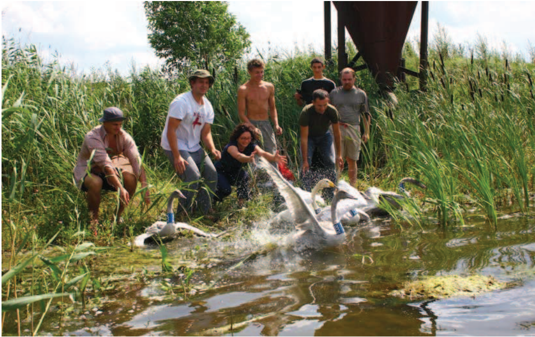
Paleidžiamos žieduotos gulsės giesmininkės. Šilavoto žuvininkystės tvenkiniai, Prienų r., 2009–07–22