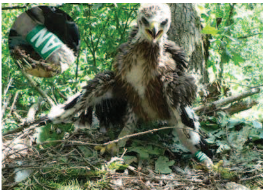
Mažasis erelis rėksnys ( Aquila pomarina). 2009-07-19