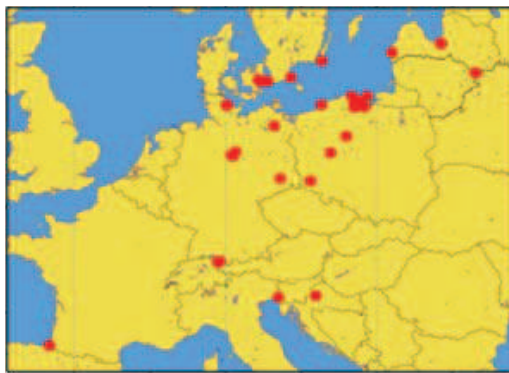
2009 m. Lietuvoje spalviniais žiedais sužieduotų sidabrinių ir kaspijinių kirų aptikimo vietos užsienyje (40 paukščių 72 stebėjimo atvejai pagal duomenis, gautus iki 2010-04-20).