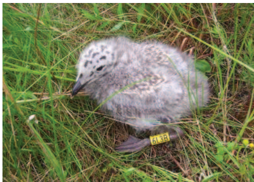
Sidabrinis kiras ( Larus argentatus ).

Šiais žiedais rudagalviai kirai 2009 m. Lietuvoje buvo žieduojami tik išimtiniais atvejais, todėl buvo paženklin-ti tik 9 paukščiai. Juos žiedavo Vytautas Pareigis.