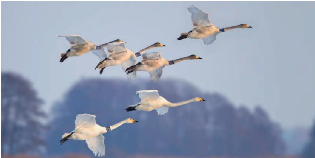
Kakliniais žiedais Lietuvoje, Prienų rajone, Meškynų kaime, pažymėtos gulgės giesmininkės žiemojo Vokietijoje, Elbe, netoli Bitte, 2011-01-05

2008 m. buvo pradėtas sistemingas gulbių giesmininkių žiedavimas jas žieduojant ne tik standartiniais metaliniais, bet ir plastikiniais kakliniais (šimtas paukščių ir kojiniiais) žiedais. Lietuvoje iki šiol žieduotų (ir tų, kurios bus žieduojamos šiais ir kitais metais) gulbių gies-