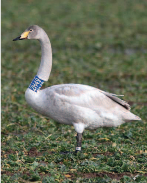
Gulbė giesmininkė, žieduota 2010-08-17 Skuodo r., Šauklių riedulyno tvenkinyje, 2011-01-25 nufotografuota rapsų lauke Vokietijoje, netoli Predöblsau

mininkių žiedų kodai (įrašai) yra tokie: 7C00–7C99, 2H00–2H99, 3H00–3H99 ir 4H00–4H99.