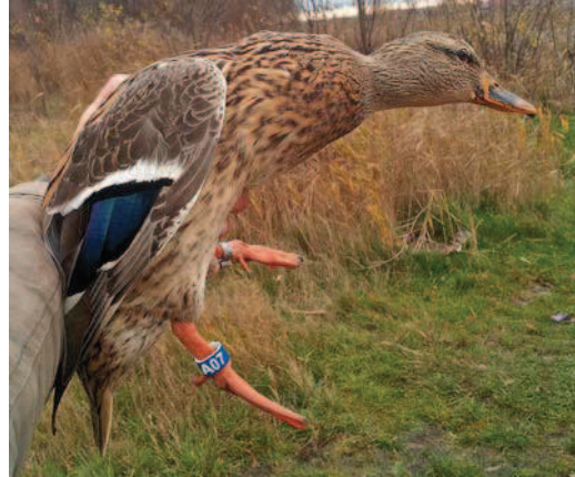
Apžieduota didžiosios anties patelė. Klaipėda, 2013-11-12

Pastebėję tokiu (taip pat ir kitokiu) žiedu paženklintą didžiąją antį (taip pat bet kokią kitos rūšies žieduotą paukštį), praneškite žiedo spalvą ir įrašą (kodą), stebėjimo datą ir vietą Lietuvos paukščių žiedavimo centrui el. paštu zcentras@takas.lt arba telefonu Kaune 8-37 205870. Jeigu paukštis nufotografuotas, o nuotraukoje (nepriklausomai nuo jos kokybės) matyti žiedas, labai prašome ją atsiųsti.