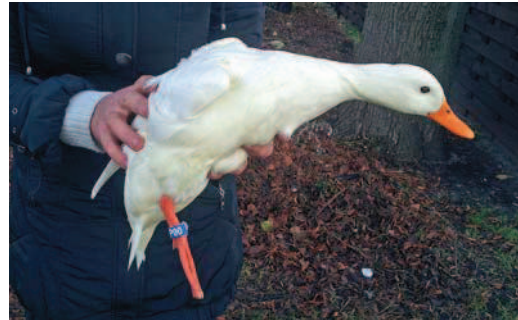
Didžioji antis albinosė, apžieduota spalviniu žiedu. Rąžės upelis, Palanga, 2013-11-18