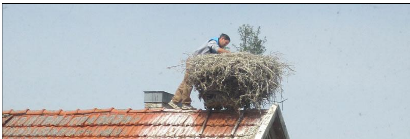
Baltųjų gandrų ( Ciconia ciconia) žiedavimas. 2014-06-19, Ventės ragas